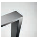
70 x 30 mm