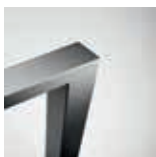
40 x 40 mm