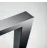
70 x 70 mm