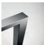
50 x 50 mm