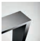
100 x 40 mm