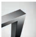
60 x 60 mm